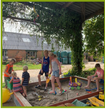
FOTO DELLA FATTORIA