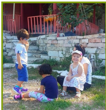
FOTO DELLA FATTORIA